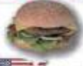
ハンバーガー アメリカ合衆国