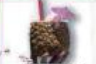
トロピカルジュース ハワイ（アメリカ）