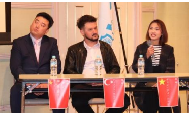
3名の外国人講師の方々 (写真左から、中国、トルコ、ベトナム)