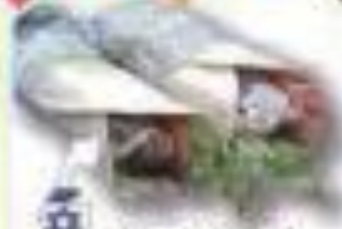
ビーフラップ イスラエル国