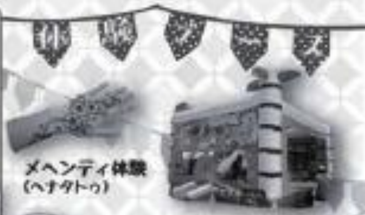
メヘンティ体験 (ヘナタトゥ)