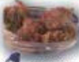
台湾から来た 台湾