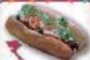
バインミー ベトナム社会主義共和国