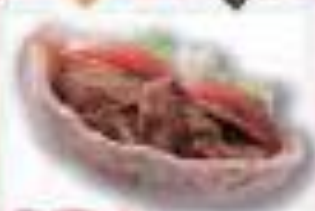
ケバブ トルコ共和国