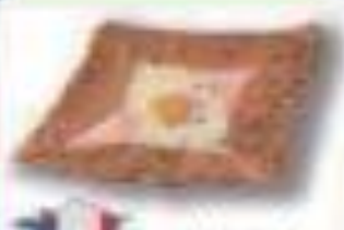
ガレット フランス共和国