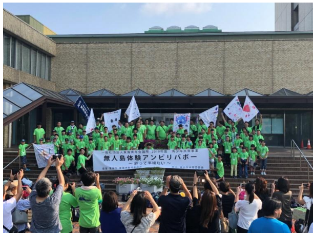
東海市役所にて出発式