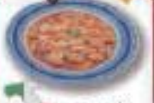
ニコッキ イタリア共和国