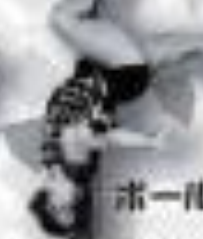
ポールダンス 体験