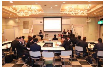
外国人講師3名とパネラーによるパネルディスカッションの様子。