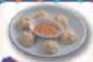
ネパール餃子 ネパール連邦民主共和国