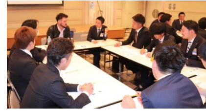
グループディスカッションの様子。 (写真はトルコ人講師の方によるグループ)