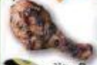
ジャークチキン ジャマイカ