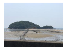
前島：干潮時。 干潮時に歩いて島まで渡ります。

2019年8月3日～4日、青少年共育事業「無人島体験アンビリバボー～絆って半端ない～」が西尾市東幡豆町の前島で開催されました。本例会は東海市に住まう小学校高学年の児童を対象とした青少年共育を目的とした事業です。8月例会は毎年青少年共育事業が開催されていますが、本年は、コミュニケーションの大切さを伝える目的で本例会が開催されました。現在は便利で豊かな生活を当たり前のように送れますが、その一方でコミュニケー