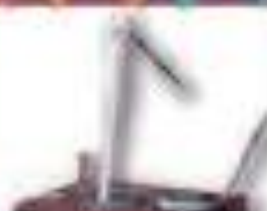
トルコアイス トルコ共和国